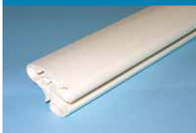
Für sandfarbene Innenhüllen Kombi-Handlauf in sand