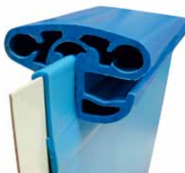
Profilschiene (Hart-PVC): Kombi-Handlauf 40 mm Bodenschiene 25 mm