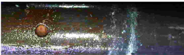
Stark verschmutzte Sonde

Alle diese Elektroden benötigen eine regelmäßige Reinigung und Kalibrierung. Häufig wird der falsche Ausdruck "Eichen" verwendet, aber Eichen ist ein amtlicher Vorgang und darf nur das Eichamt durchführen. Ein regelmäßiges Kalibrieren reicht nicht aus, da sich auf der Elektrode auch ein Belag aus Bakterien, Kalk, oder sonstigen Verunreinigungen bildet. Dieser Belag verändert den "echten" Wert z.B. beim pH um 2,0 und beim Redox um bis zu 250 mV und muß auch mechanisch entfernt werden.