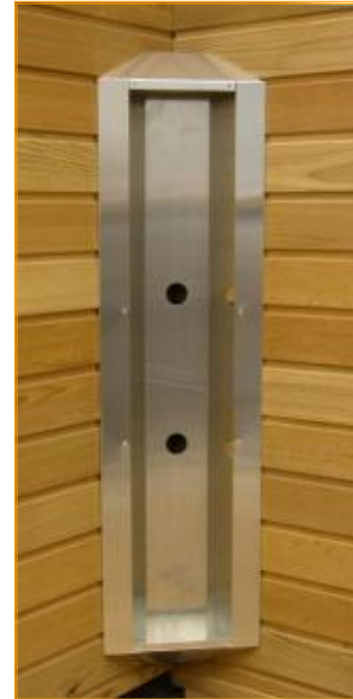
Eckmodul, ROTlicht+WEISSlicht+ Strahler und gefräster Aluminiumrahmen bilden eine harmonische Einheit, die bei jeder verwendeten Holzart einen geschmackvollen Eindruck macht.