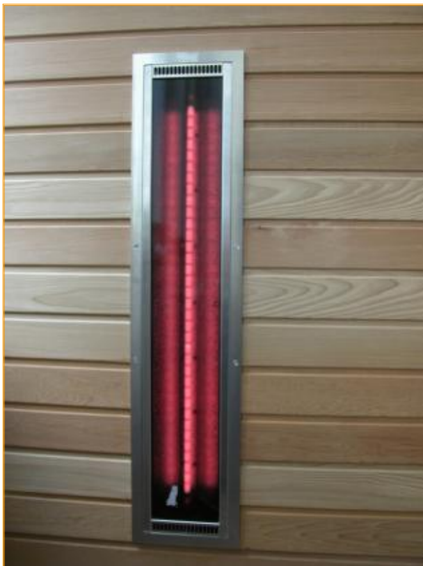
Der ROTlicht+ Infrarotstrahler, eingebaut in eine Kabinenwand.

Die Eigenschaften des Vollspektrums finden Sie ausführlich beschrieben im Kapitel ‚Saunafluter‘ und bei den herkömmlichen Vollspektrum Reflektorstrahlern, sodass wir hier nicht noch einmal darauf eingehen müssen.