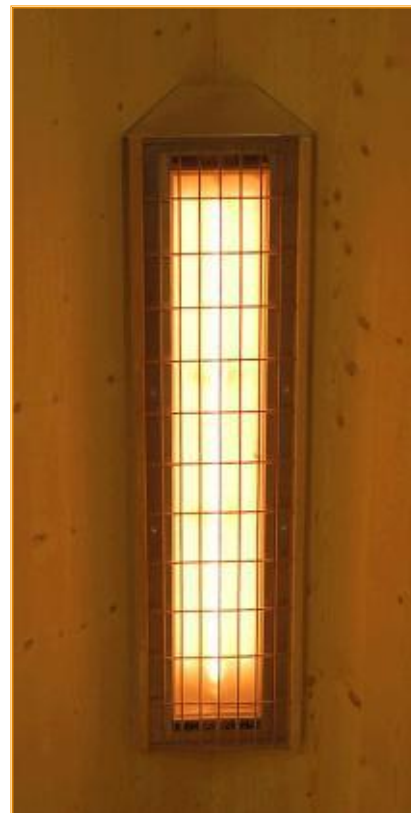
Der WEISSlicht+ Infrarotstrahler eingebaut in einem Eck-Einbaumodul mit vorgebautem Berührungs-Schutzgitter